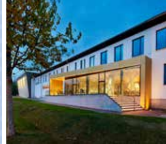
Winzervereinigung Freyburg-Unstrut eG